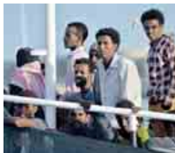
mila persone sono sbarcate in Europa: 54 mila in Italia, 48 mila in Grecia, 920 in Spagna e 91 a Malta.

Gli sbarchi di profughi e migranti in Europa hanno superato quest'anno la quota di 100.000, con arrivi concentrati quasi esclusivamente in Italia e nelle isole greche, secondo stime dell'Alto Commissario Onu per i profughi e dell'OIM (Organizzazione Internazionale per le Migrazioni). Secondo l'OIM, la quasi totalità degli sbarchi in Italia viene dalla Libia, mentre siriani e afgani puntano sulla Grecia partendo dalla Turchia. All'8 giugno, secondo le stime dell'UNHCR, un totale di 103