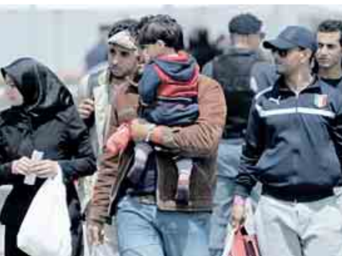
Profughi giunti nel nostro paese

Poi c'è l'altra ondata di arrivi, quella che sfugge alla contabilità