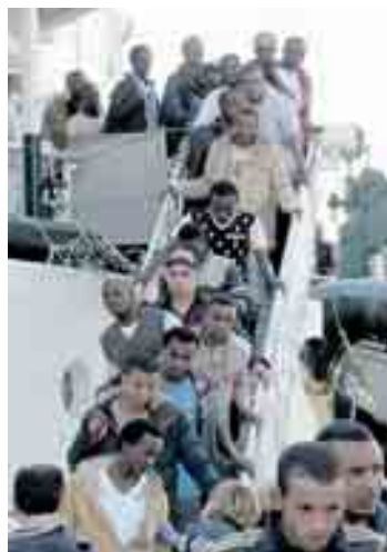
Sbarchi di migranti

Nella riunione della prossima settimana dei ministri dell'Interno della Ue non ci sarà «nessuna decisione», spiega il portavoce della presidenza lettone del Consiglio, Janis Berzins: «Avremo un dibattito di orientamento politico tra i ministri» sull'agenda per l'immigrazione presentata dall'esecutivo di Jean-Claude Juncker. Ma un compromesso per far partire il primo luglio il cosiddetto «meccanismo di risposta di emergenza», che dovrebbe permettere di trasferire 24 mila migranti dall'Italia e 16